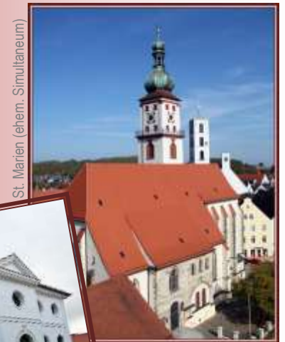
St. Marien (ehem. Simultaneum)

KATHOLISCHE ERWACHSENENBILDUNG BISTUM REGensburg e.V.