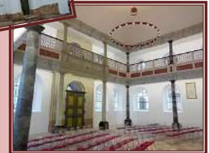
Innenraum ehem. Synagoge