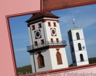
St. Marien | Evang. Christuskirche Kirchtürme