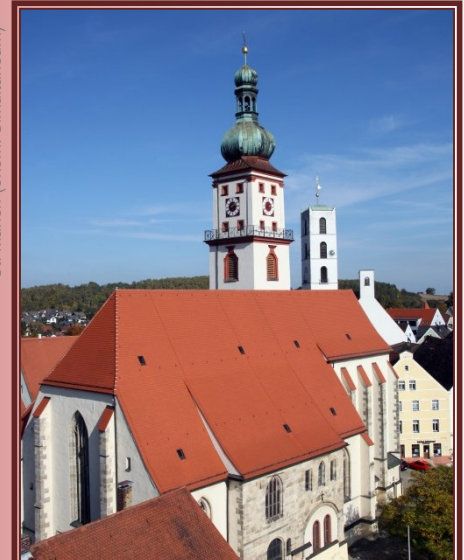
St. Marien (ehem. Simultaneum)

Katholische Erwachsenenbildung im Bistum Regensburg e.V. Spindlhofstr. 23 93128 Regenstauf