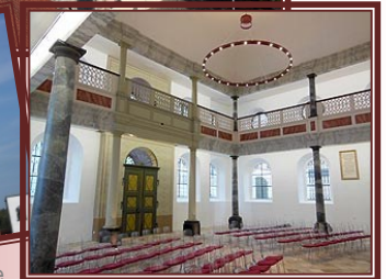
Innenraum ehem. Synagoge