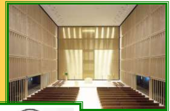
Innenraum Herz Jesu, München-Neuhausen 2000