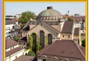
Jüdisches Kulturmuseum Augsburg-Schwaben, mit Synagoge

Mit öffentlichen Verkehrsmitteln erreichen Sie das JKM vom Königsplatz oder vom Hauptbahnhof aus in fünf Gehminuten.