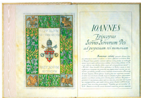
BULLE «HUMANAE SALUTIS» JOHANNES' XXIII. ZUR EINBERUFUNG DES ZWEITEN VATIKANISCHEN ÖKUMENISCHEN KONZILS

Die Kommission erwartet vom Europäischen Jahr der Freiwilligentätigkeit, dass mehr Menschen sich ehrenamtlich engagieren und dass das Bewusstsein für den Mehrwert dieses Engagement gesteigert wird. Weiterhin soll die Verbindung von Freiwilligentätigkeiten auf lokaler Ebene und ihrer Bedeutung in einem umfassenderen europäischen Kontext hervorgehoben werden. Und schließlich sollen die Freiwilligen dank des Europäischen Jahres mehr Anerkennung erhalten.