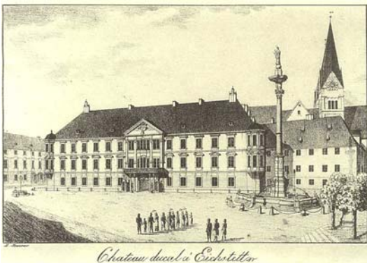
Abbildung: Die ehemalige Fürstbischöfliche Residenz (heute Landratsamt) mit der barocken Mariensäule und dem mittelalterlichen Dom.